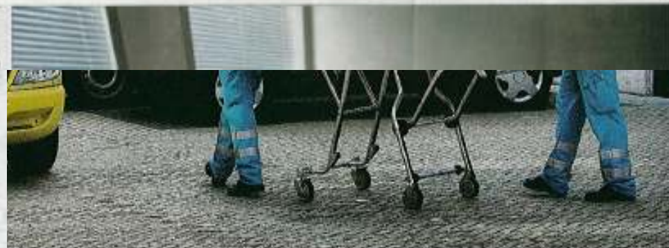
den met ambulances naar andere instellingen overgebracht.